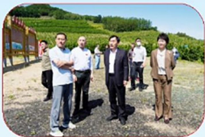
市政协副主席张文才对 我市推进乡村建设情况进行调研