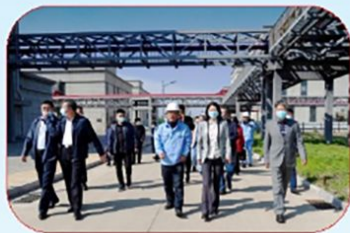
市政协副主席孙秀云调研 我市生物医药产业发展情况