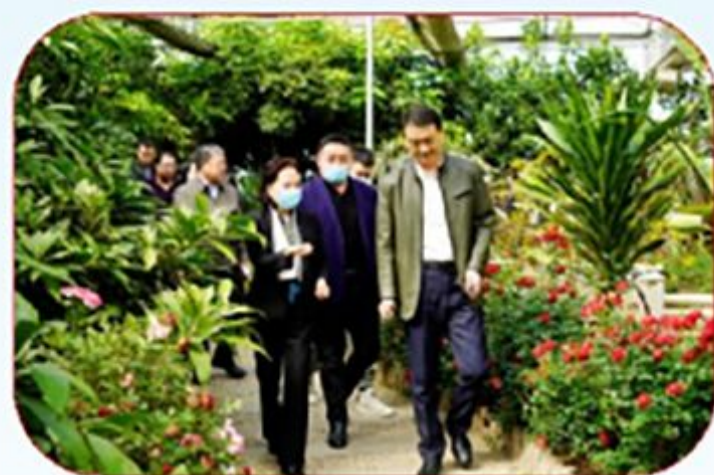
市政协副主席李敏花 调研我市乡村旅游发展情况