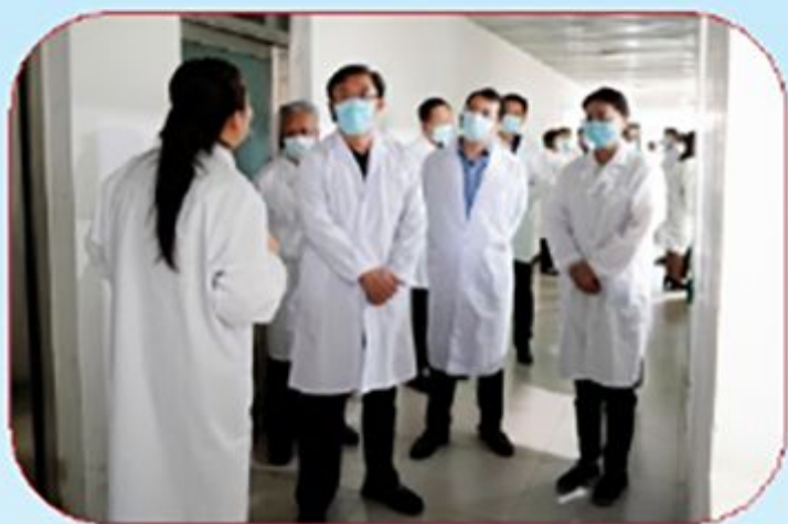
市政协主席王德胜赴 桦甸市调研肉牛产业发展情况