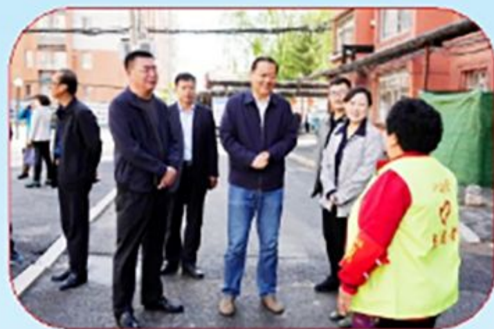
市政协副主席刘长木督导“七边”环境 卫生治理及全国文明城市常态长效创建工作