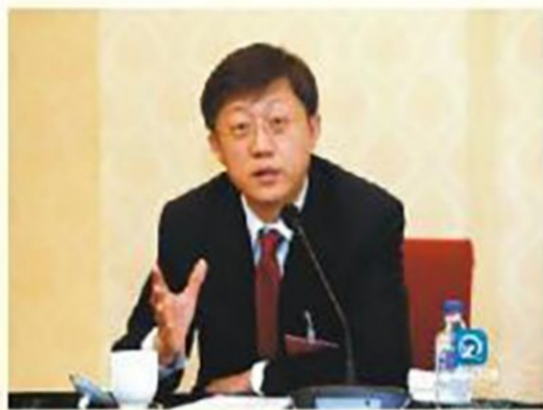
市长刘非与委员座谈时发表意见