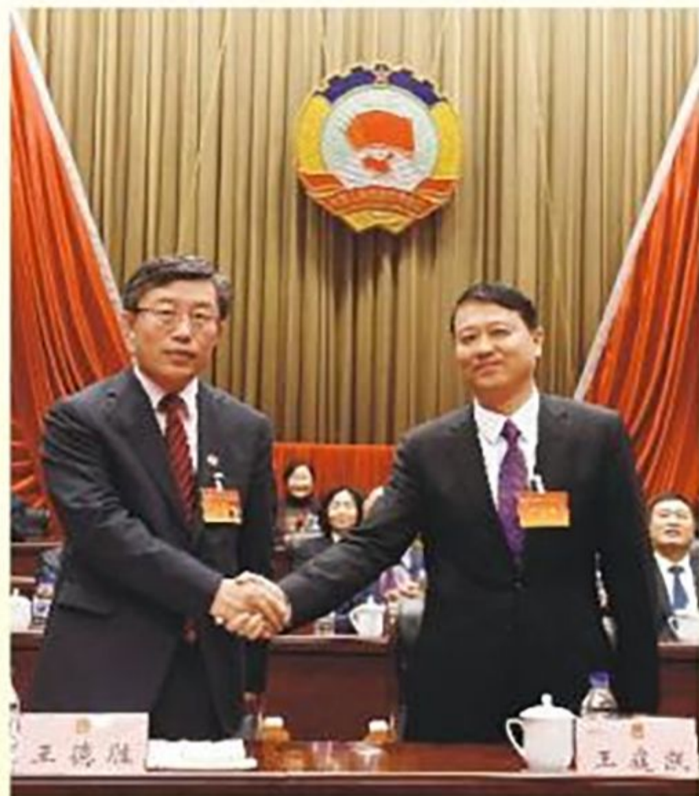
新当选的十三届市政协主席王德胜与市委书记王庭凯握手