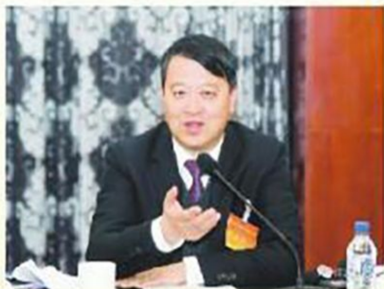
市委书记王庭凯与委员座谈时发表意见