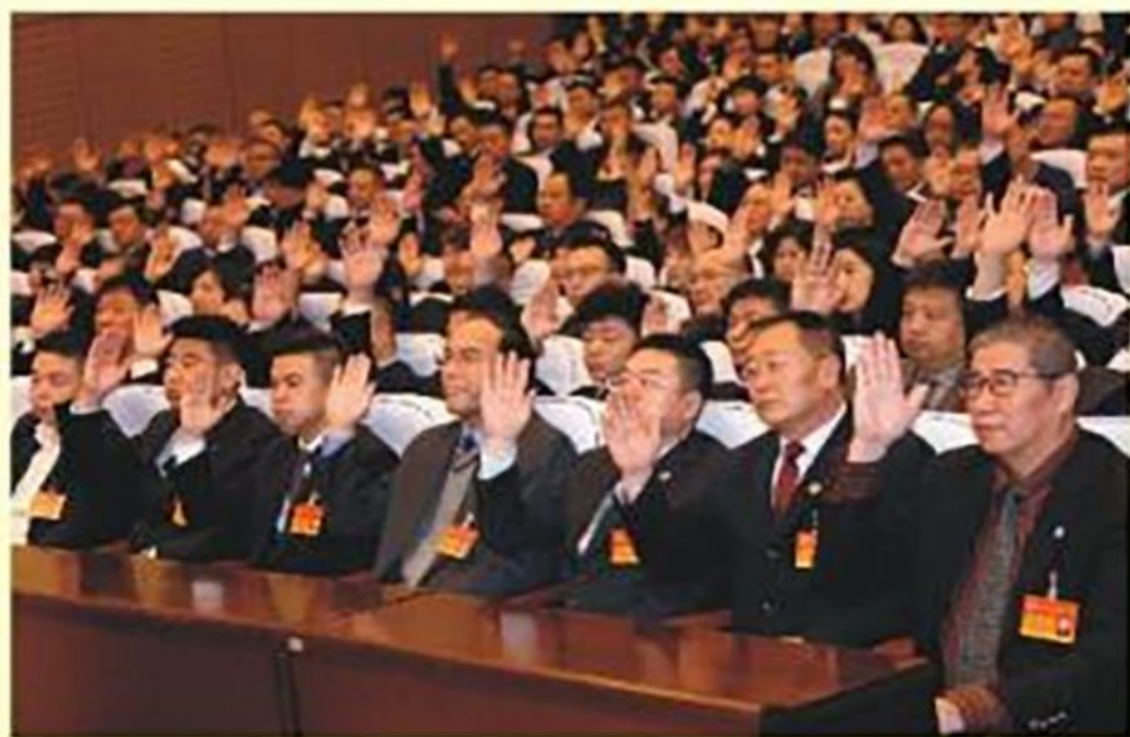
委员审议通过政协吉林市第十三届委员会第三次会议决议