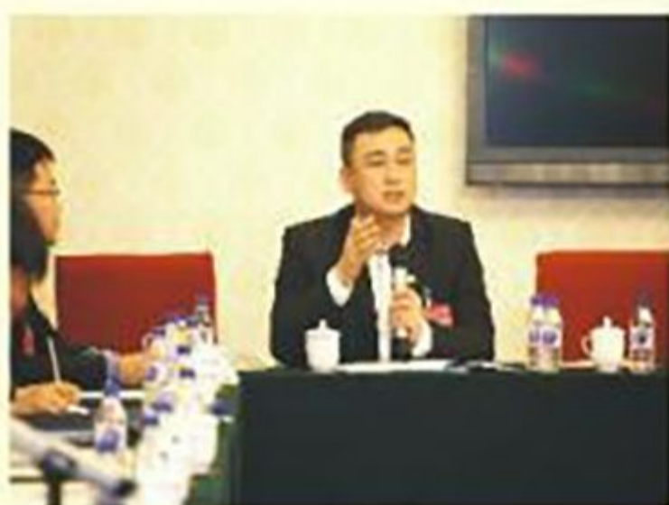
市政协委员在小组讨论时发言