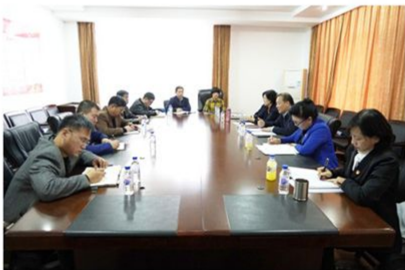
市政协第二党支部举办主题教育集中学习研讨会暨专题党课活动