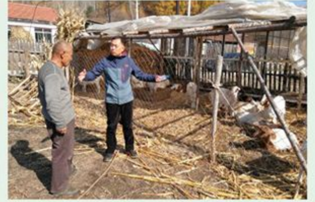
市政协办公室到包保村慰问