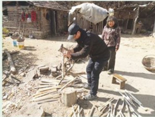
市政协人资环委到包保村慰问