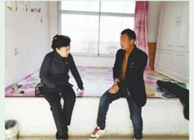
市政协提案委到包保村慰问