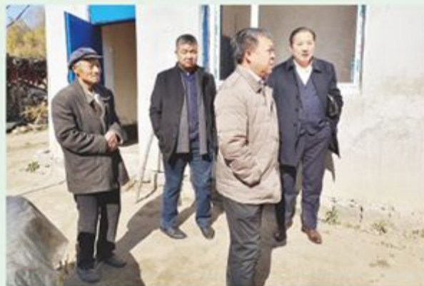
市政协文史委到包保村慰问