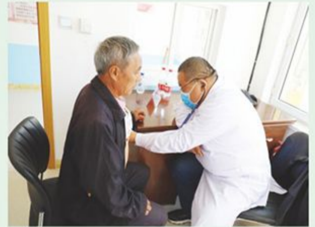
市政协文教委到包保村慰问