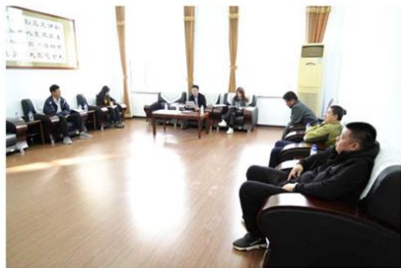
市政协第五党支部举办主题教育集中学习研讨会暨专题党课活动