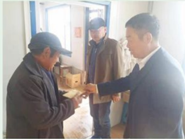
市政协机关党委到包保村慰问