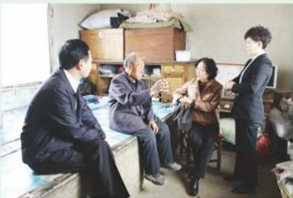
市政协社法委到包保村慰问