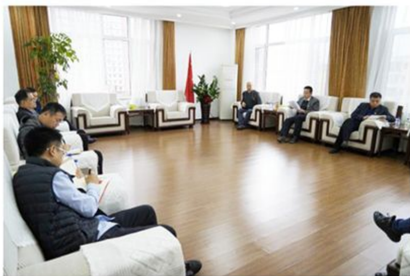
市政协第一党支部举办主题教育集中学习研讨会暨专题党课活动