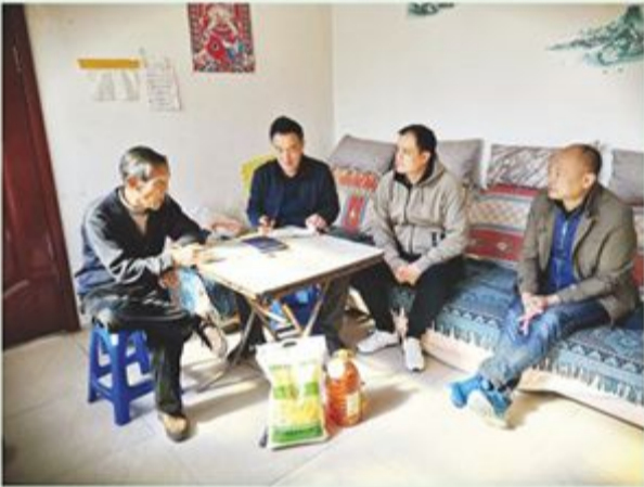
市政协研究室到包保村慰问