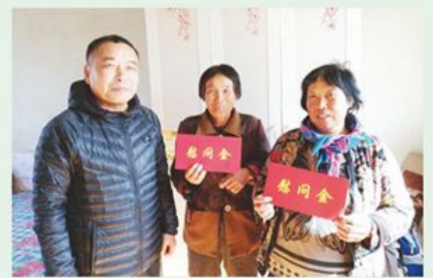
市政协外联委到包保村慰问