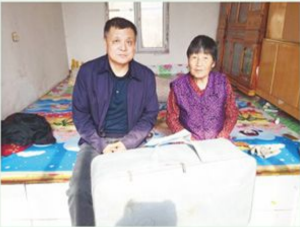
市政协经科委到包保村慰问