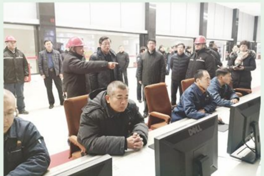
市政协主席王德胜到吉林石化炼油厂调研大气污染防治情况