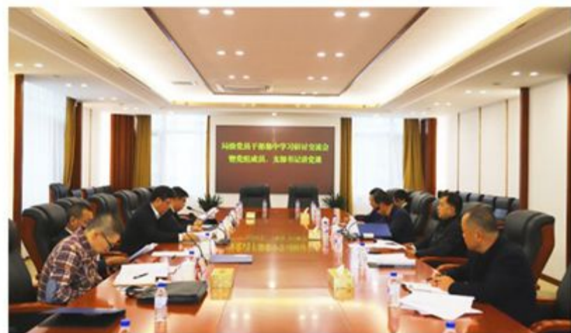
市政协第四党支部举办主题教育集中学习研讨会暨专题党课活动