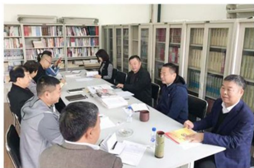
市政协第三党支部举办主题教育集中学习研讨会暨专题党课活动