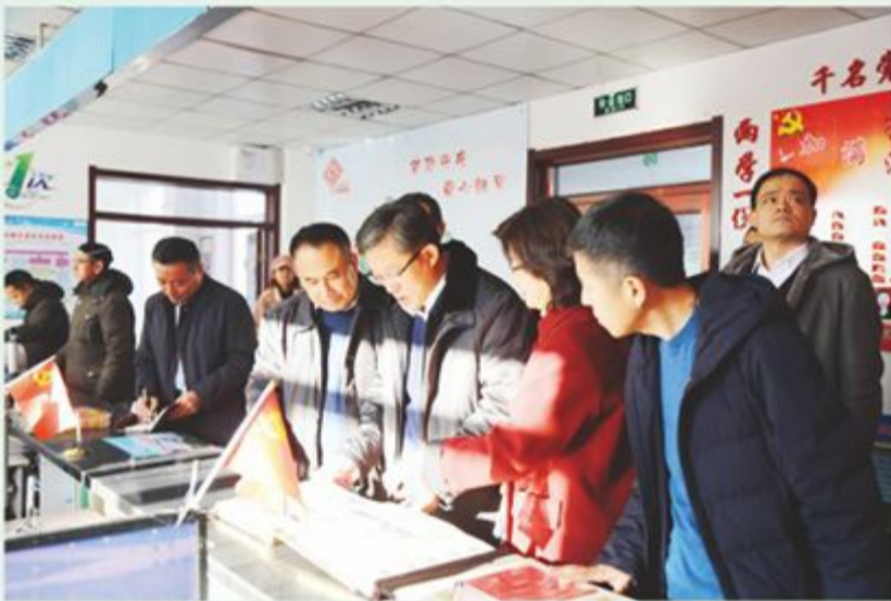
市政协主席王德胜深入龙潭区榆树街道政协委员联络站调研