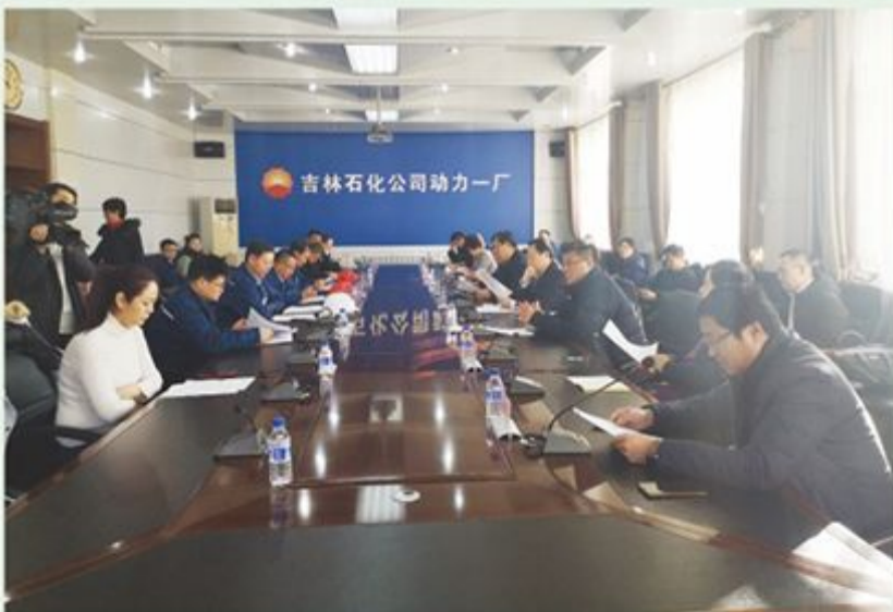
市政协主席王德胜到吉林石化动力一厂调研大气污染防治情况