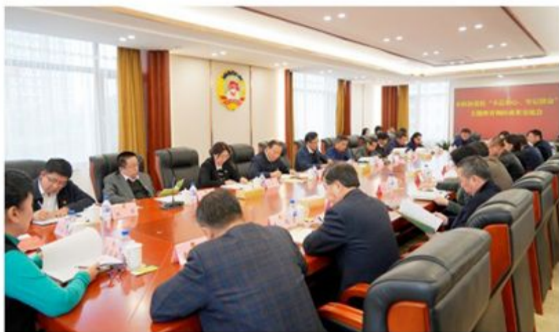
市政协党组召开主题教育调研成果交流会