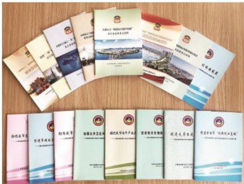
吉林市政协组织开展17次双月协商。