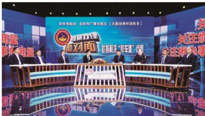
吉林市政协在全省首创《吉事好商量·提案办理面对面》栏目。

吉林市政协认真落实党的十九届六中全会精神，积极探索人民政协参与基层治理的有效途径和方式，创新提案办理机制，走出新时代加强和改进提案办理工作的新路子。建立党委政府领导领办、政协领导督办重点提案制度，有效带动提案办理。创建“互联网+提案”办理模式，升级市政协“提案办理系统”，实现全程网上、掌上提交和办理提案。