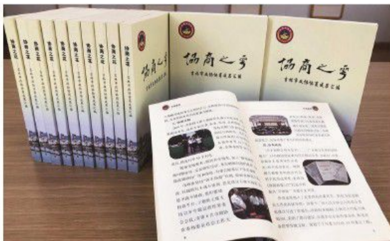
吉林市政协编印《协商之花—吉林市十三届政协协商成果汇编》。