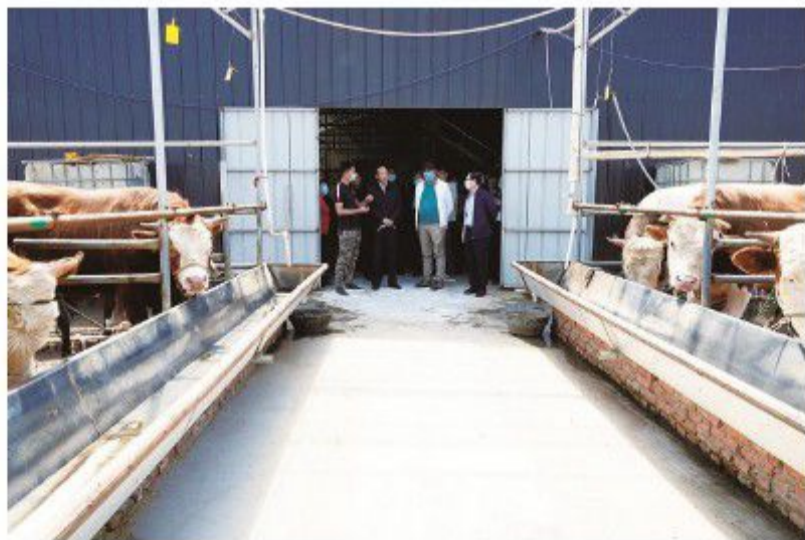
吉林市政协推进协商成果转化落实。