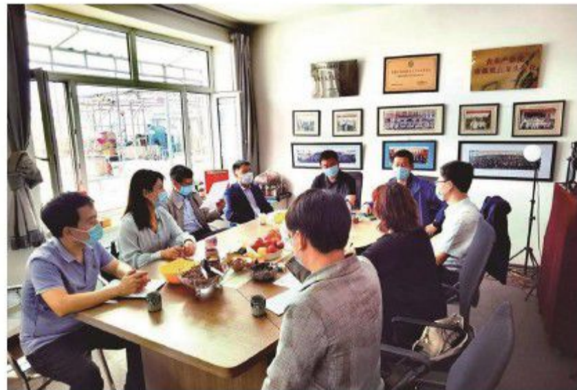
吉林市政协委员深入企业调研，加快促进校企合作。头版予以报道。

为高效快速反映社情民意信息，吉林市政协创办《政协委员“直通车”》刊物，将政协委员和民主党派的建议，以“直通车”形式直报市委、市政府领导。《政协委员“直通车”》已经成为市领导了解社情民意的重要窗口和快捷通道，市委、市政府主要领导多次作出批示。《人民政协报》以《发车了！这趟列车让他们的心路更近了》为题，对市政协首期《政协委员“直通车”》作了专门报道。