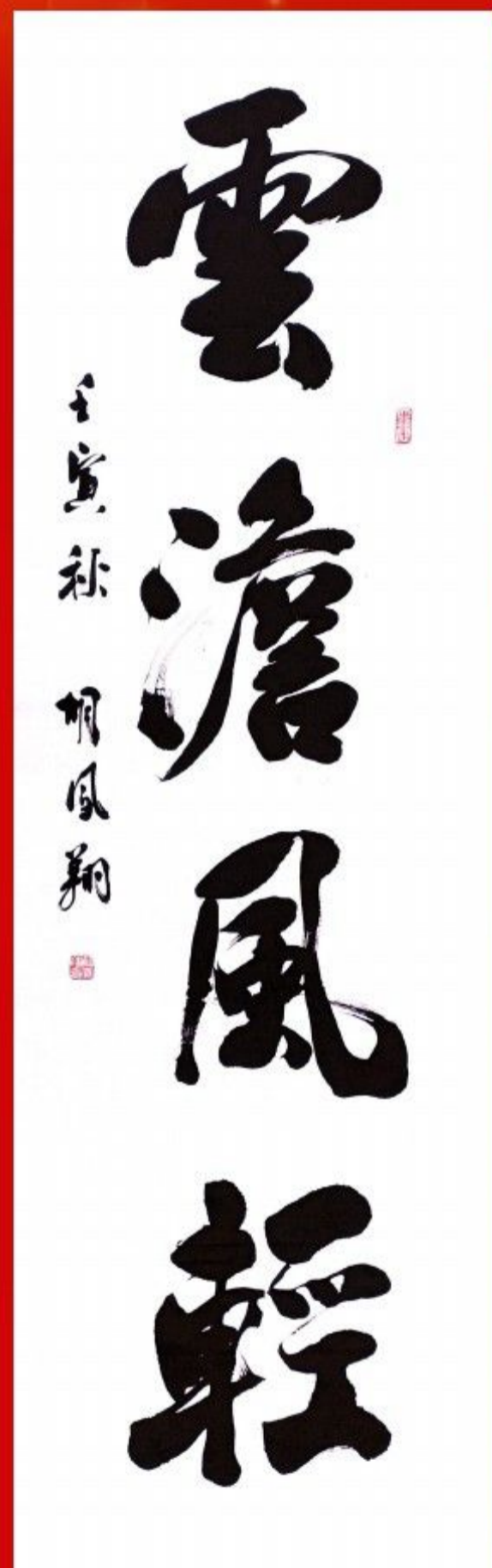
书法：云淡风轻 作者：胡凤翔