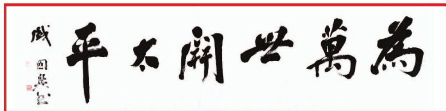
书法：为万世开太平