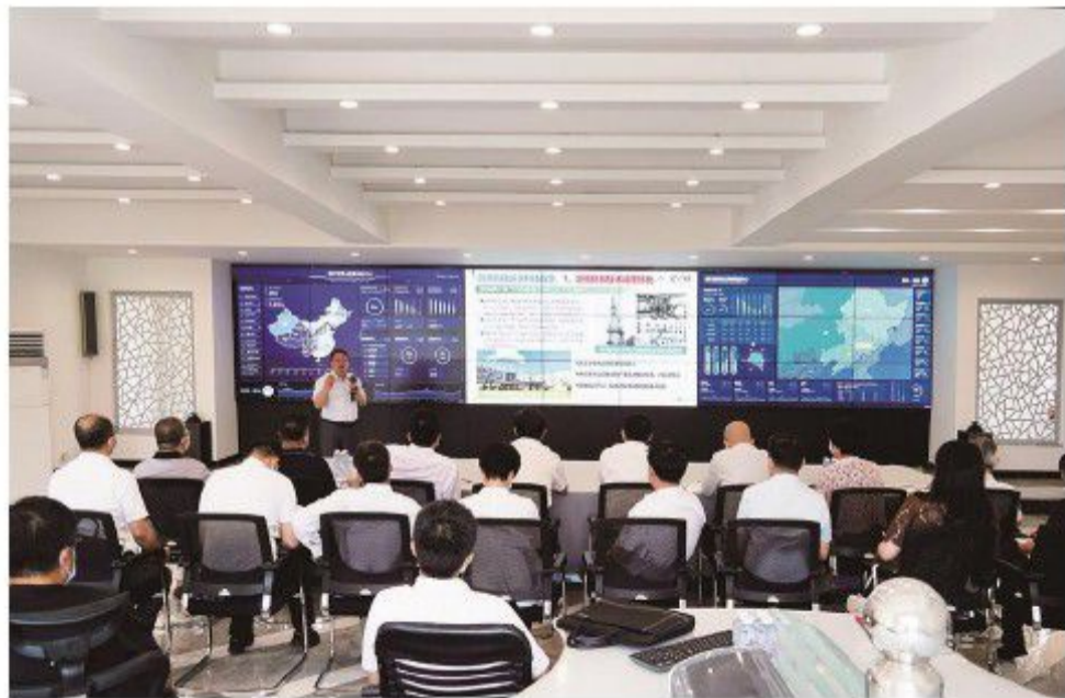
吉林省政协组织开展在线新经济专题调研。

小小微信群已成为委员议政大平台。目前，吉林省政协共组织开展促进市乡村旅游、加快现代物流产业发展、培育“专精特新”中小企业等网络议政活动20余次。《人民政协报》刊发的《“掌上政协”开启委员履职“云时代”》的报道，新华社客户端点击量突破54万人次。