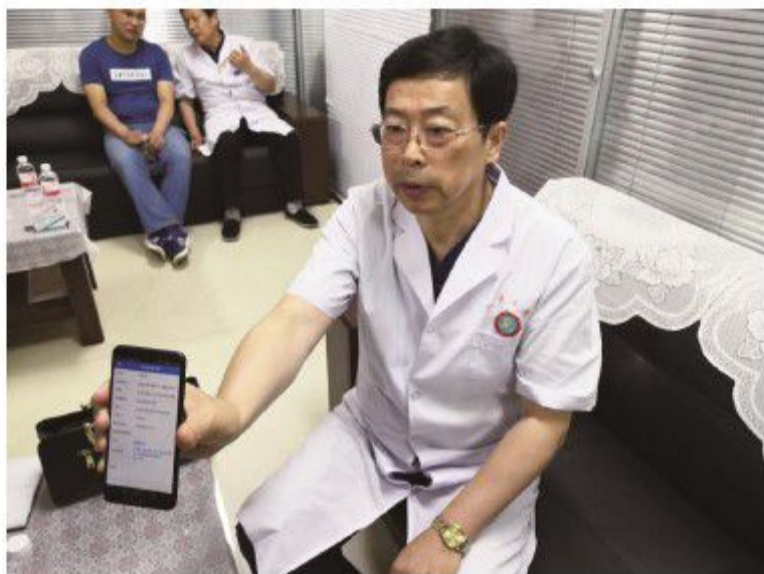
吉林省政协委员通过“江城政协”手机APP提交提案。

出台《吉林省政协关于加强和改进界别工作的意见》，引导委员广泛联系服务界别群众。制定下发《关于强化市政协委员责任担当的实施意见》，开展委员履职“五个一”活动，即委员每年撰写一份提案、反映一篇社情民意、参加一次学习培训、参与一次履职活动、办成一件民生实事，引导委员为国履职、为民尽责。