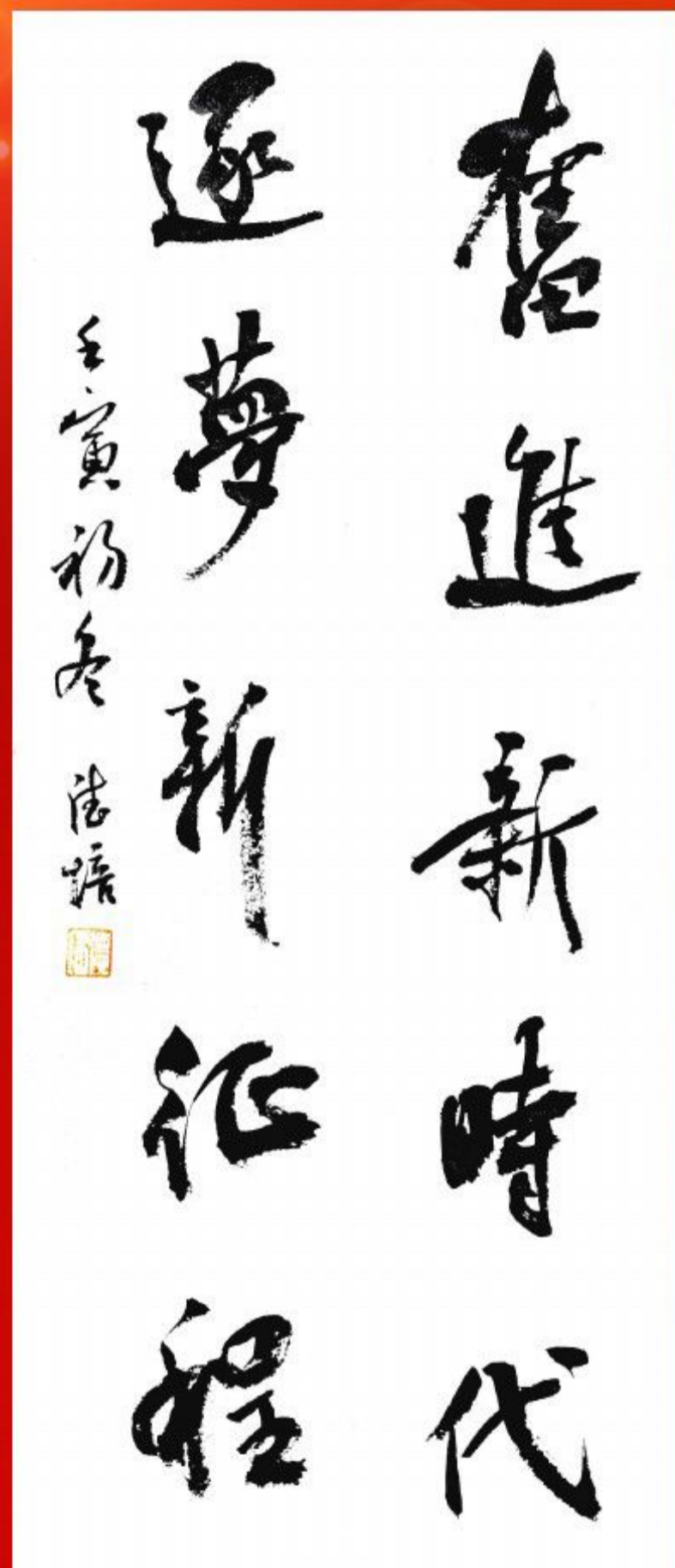
书法：奋进新时代 逐梦新征程 作者：刘德培